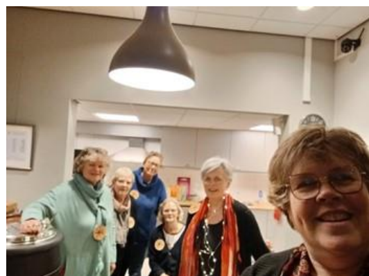
Deel van de diaconie in actie bij het schenken van Choclademelk tijdens de Lichtjestocht op kerstavond

We willen u allen bedanken voor uw bijdragen in welke vorm dan ook. Dat heeft het voor ons mogelijk gemaakt, te helpen waar dit nodig was. Ook komend jaar zullen we weer een beroep op uw doen.